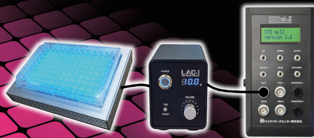
インキュベータ対応LEDアレーシステム